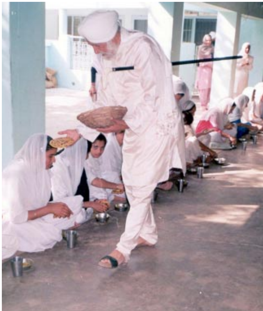
ਸੰਤ ਮਹਾਰਾਜ ਰਤਵਾੜਾ ਸਾਹਿਬ ਵਿਖੇ ਲੰਗਰਾਂ ਵਿੱਚ ਲੰਗਰ ਵਰਤਾਉਣ ਦੀ ਸੇਵਾ ਕਰਦੇ ਹੋਏ।

ਇਹ ਜਿਹੜੇ ਮਜ਼ਦੂਰ ਨੇ ਮਜ਼ਦੂਰੀ ਲੈਂਦੇ ਨੇ ਉਨ੍ਹਾਂ ਨੇ ਲਾਉਣੇ ਨੇ। ਮੈਂ ਕਿਹਾ, ਮੈਨੂੰ ਵੀ ਦੇ ਦਿਓ ਮਜ਼ਦੂਰੀ। ਮੈਂ ਵੀ ਲੈ ਲਊਂਗਾ, ਮੇਰੇ ਕੋਲ ਕਿਹੜਾ ਪੈਸਾ ਹੈਗਾ। ਪਰ ਉਹ ਮਜ਼ਦੂਰੀ ਪੈਸੇ ਦੀ ਨਹੀਂ ਹੈ। ਕਹਿਣ ਲੱਗੇ, “ਉਹ ਕੀ ਹੈ?” ਮੈਂ ਕਿਹਾ ਤੁਹਾਡੇ ਨਾਲ ਮੈਂ ਅੱਜ ਗੁਡਾਈ ਕਰਕੇ ਜਪੁਜੀ ਸਾਹਿਬ ਯਾਦ ਕਰਾਉਣੈ ਪੰਜ ਪਉੜੀਆਂ ਤੇ ਨਾਲੇ ਮੈਂ ਕਿਆਰਾ ਵਿਚਾਲੇ ਰੱਖ