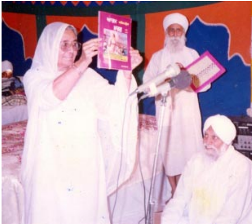
ਪਰਮ ਸਤਿਕਾਯੋਗ ਬੀਜੀ ਵਿਸਾਖੀ 1995 ਨੂੰ ਆਤਮ ਮਾਰਗ ਰਿਲੀਜ਼ ਕਰਦੇ ਹੋਏ।

ਵਿਚ ਸੀ ਕਿ ਇਹਨੂੰ ਕੋਈ ਪੂਰਾ ਸੰਤ ਮਿਲ ਜਾਵੇ ਤਾਂ ਚੰਗਾ ਹੈ। ਅਜੇ ਤੱਕ ਇਹ ਤੁਰਿਆ ਰਹਿੰਦੈ ਸੰਤਾਂ ਦੇ, ਉਹਦੇ ਕੋਲ ਚਲਾ ਗਿਆ, ਉਹ ਸੰਤਾਂ ਦੇ ਬਚਨ ਸੁਣ ਲਏ, ਉਨ੍ਹਾਂ ਦਾ ਕੀਰਤਨ ਸੁਣ ਲਿਆ, ਸਾਰੀ-ਸਾਰੀ ਰਾਤ ਸੁਣੀ ਜਾਂਦੈ। ਉਹ ਮੈਨੂੰ ਰਾੜਾ ਸਾਹਿਬ ਲੈ ਗਏ ਮਾਘ ਦੇ ਮਹੀਨੇ 'ਚ, ਜਦ ਢੱਕੀ ਤੋਂ ਆ ਗਏ ਸੀ ਸੰਤ ਮਹਾਰਾਜ। ਪਹਿਲਾਂ ਵੀ ਅਸੀਂ ਜਾਂਦੇ ਸੀ ਕੀਰਤਨ ਸੁਣਦੇ ਸੀ ਉਨ੍ਹਾਂ ਦਾ ਢੱਕੀ ਵਿਚ। ਲੇਕਿਨ ਨੇੜੇ ਹੋਣ ਦਾ ਨਹੀਂ ਸੀ ਸੁਭਾਗ ਪ੍ਰਾਪਤ ਹੋਇਆ, ਦੂਰੋਂ ਹੀ ਕੀਰਤਨ ਸੁਣਨਾ, ਕੁਛ ਮਹਾਰਾਜ ਵੀ ਘੱਟ ਮਿਲਦੇ ਸੀ, ਜ਼ਿਆਦਾ ਨਹੀਂ ਸੀ ਮਿਲਦੇ ਥੋੜ੍ਹਾ ਹੀ ਮਿਲਦੇ ਸੀ।